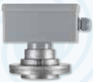
▶ Druckmelder MSD-070