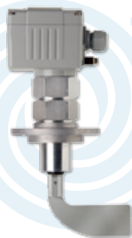
▶ Bedarf- und Leermelder DF23