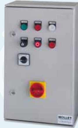
▶ Elektrische Steuerung S-EST