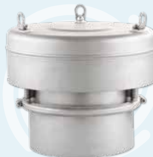
▶ Silo-Ex-Implo SEI