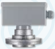
▶ Druckmelder MSD-070