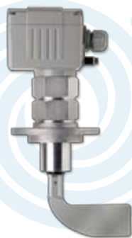
▶ Bedarf- und Leermelder DF23