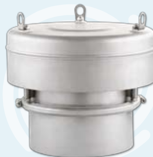
▶ Silo-Ex-Implo SEI