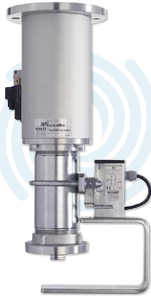
▶ Sperrventil SFA