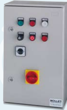
▶ Elektrische Steuerung S-EST