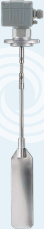
▶ Vollmelder DF26